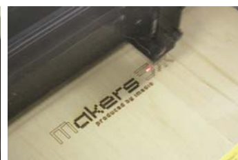
レーザーカッター