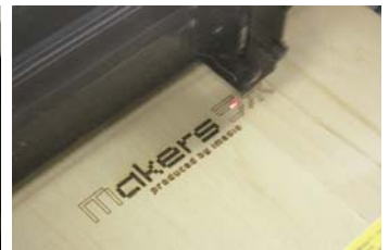
レーザーカッター