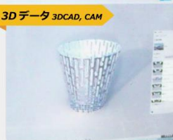
3D データ 3DCAD, CAM